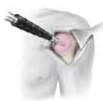
Brocado para el cajetín humeral