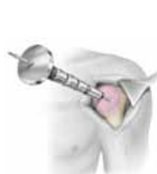
Impactación del cajetín humeral