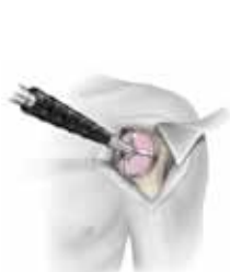
Fresado de la cabeza humeral sobre la aguja de Kirschner