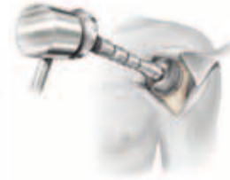
Impactación de la cabeza humeral de resuperficialización