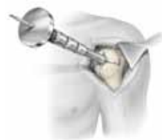
Aguja de Kirschner sobre el mango canalado